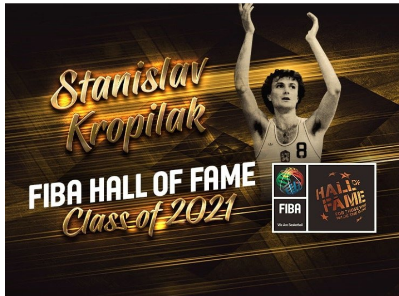
Obrázok 7. Zaradenie S. Kropiláka do FIBA siene slávy (Fiba.com 2022).

Stanislav Kropilák, ktorý je široko uznávaný ako najlepší slovenský basketbalista 20. storočia, bol v roku 2021 uvedený do Siene slávy FIBA. Toto ocenenie je vrcholom jeho bohatej kariéry a znamená medzinárodné uznanie jeho prínosu k basketbalu.