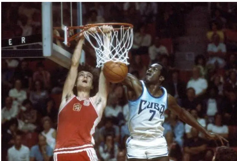
Obrázok 3. Stanislav Kropilák na OH v Montreale 1976 (Basketeurpe.com 2022).