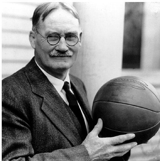
Obrázok 1. Zakladateľ basketbalu James Naismith.